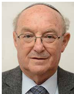
פרופ' שלמה גרוסמן נשיא המכללה האקדמית אשקלון