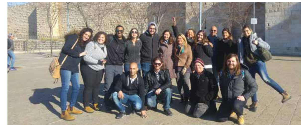
סיור בירושלים לשנה א' במסגרת הקורס "ניהול תיירות דת ומורשת"