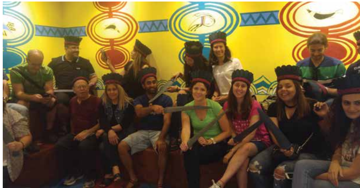
סיור למוזיאון תרבות הפלשתים באשדוד, במסגרת הקורס "ניהול תיירות דת ומורשת"