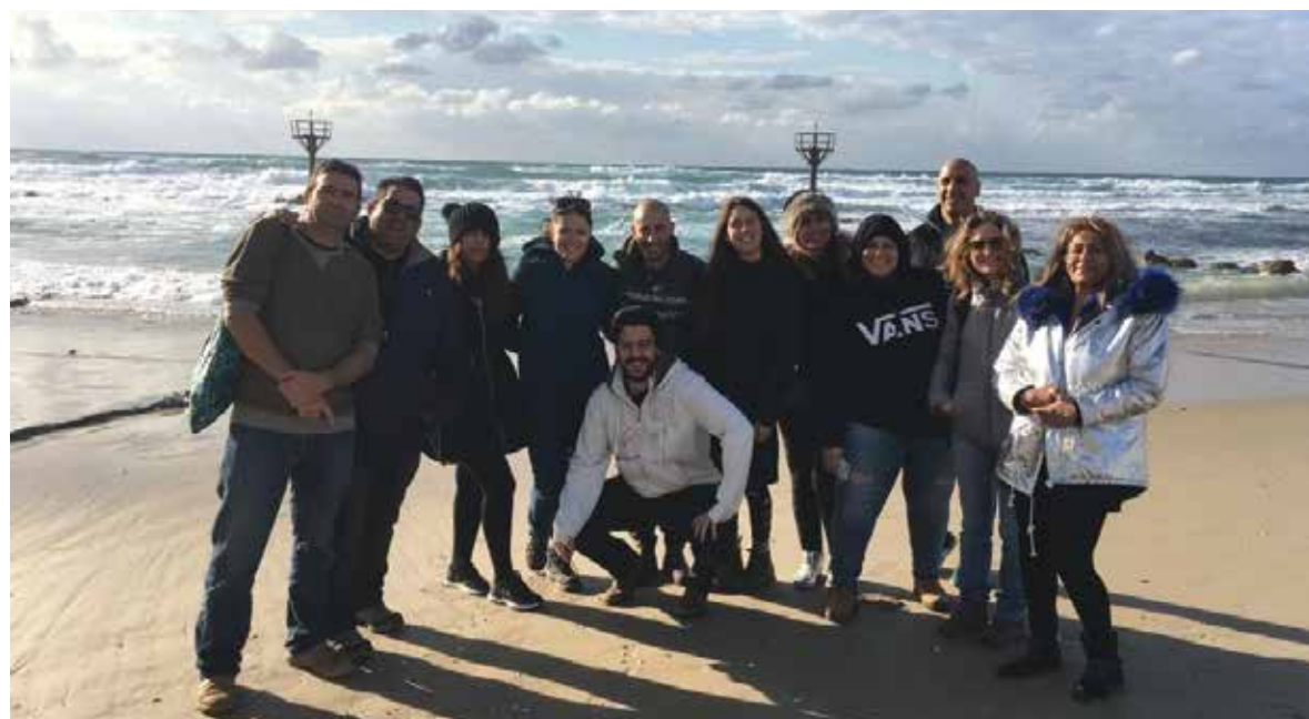
סיור במסגרת הקורס: "תיירות אקולוגית ותיירות בת קיימא"