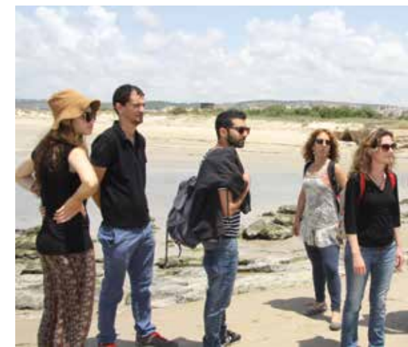
סיור בג'יסר א-זרקא בקורס "תיירות בת קיימא"