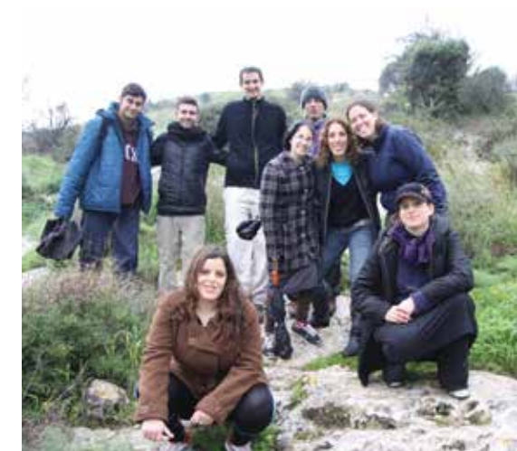
סיור בתל עזקה