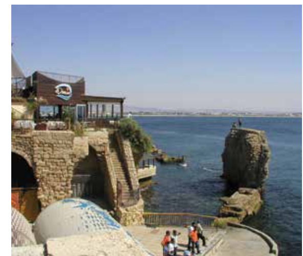
סיור בעכו בנמל הפיזאני