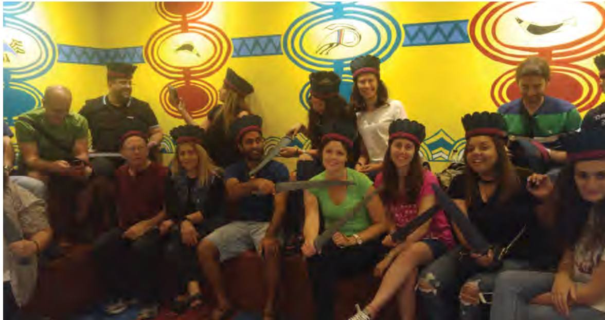
סיור למוזיאון תרבות הפלשתים באשדוד, 5.2017, במסגרת הקורס של ד"ר עמוס רון, "ניהול תיירות דת ומורשת"