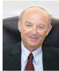
פרופ' שלמה גרוסמן נשיא המכללה