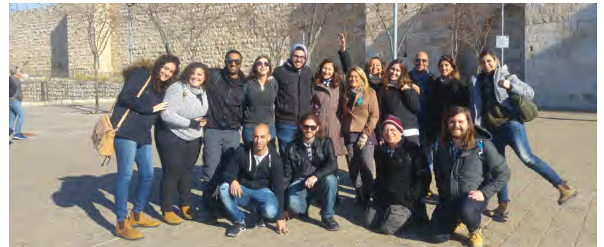
סיור בירושלים לשנה א' במסגרת הקורס של ד"ר עמוס רון, "ניהול תיירות דת ומורשת"