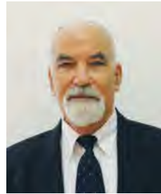
פרופ' שמעון שרביט רקטור המכללה